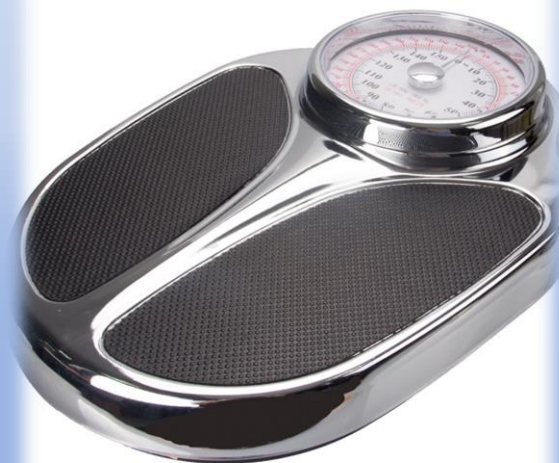
BALANZA MECÁNICA K&I CÓDIGO KI1699